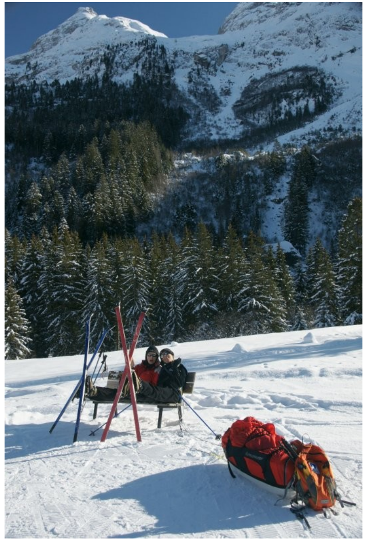
Non il n'y aura pas de banc sur notre trajet.