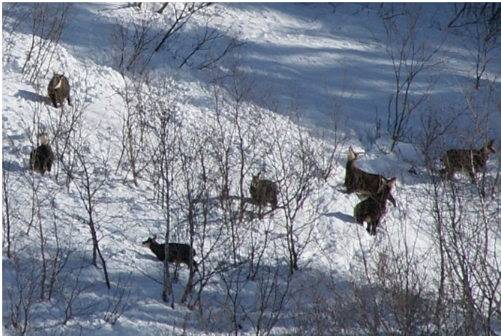
Les chamois des Alpes ont été notre version locale des caribous.

On a coutume de dire que le simple fait de partir, c'est déjà 50% de la réussite d'une expédition. Celle-ci ne déroge pas à la règle. Alors à un mois du départ, les Piétons du Grand Nord ont souhaité saluer et remercier l'ensemble des personnes qui les ont aidé à monter ce projet et à le financer.