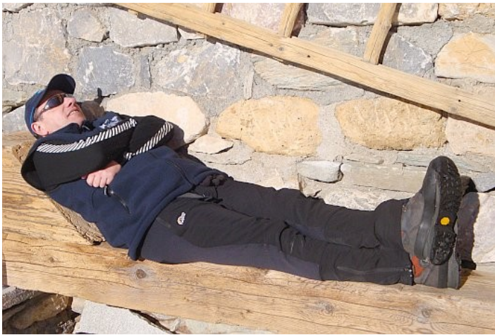
Chut ! Le chef d'expé se concentre...