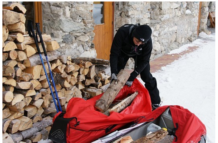
Rien de mieux que des bûches de bois pour lester les pulkas.

Bref, tout un tas de petits détails, anodins ici, mais qu'il nous faudra gérer pendant l'expédition à l'aide de notre imagination, débrouillardise et notre petite trousse de réparation.