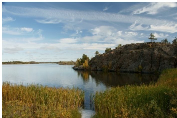
Le Frame Lake qui borde le nord de Yellowknife.

"Ma fille est Dé-Nuite" me confie Bobby dans la chaleureuse ambiance du Black Knight, le pub où nous avons établi notre quartier général dès notre arrivée à Yellowknife. Je sursaute : Bobby serait-il le témoignage parfait de cette question qui m'intrigue : qu'en est-il des relations entre inuit et Dénés ? Dans son journal de voyage Samuel Hearne nous a livré le récit terrible des Bloody Falls où les "eskimo du cuivre" furent massacrés par ses guides Chipewyans. Haine réelle ou légende ?