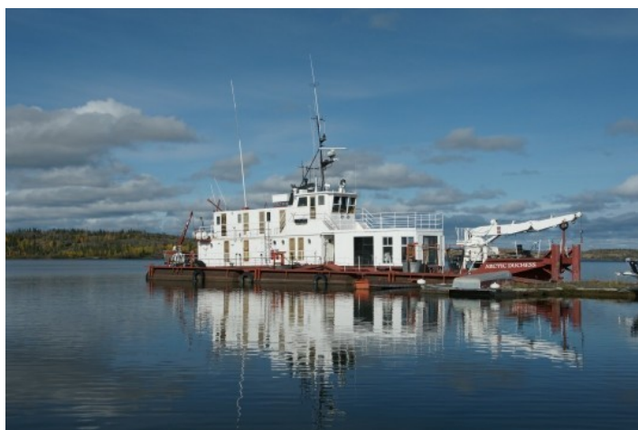
L'Arctic Princess, sur le Grand Lac des Esclaves