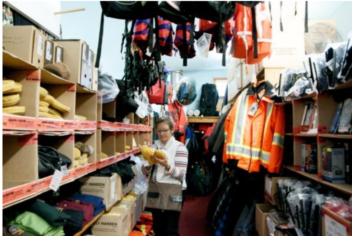
L'incontournable magasin "Weaver & Devore"