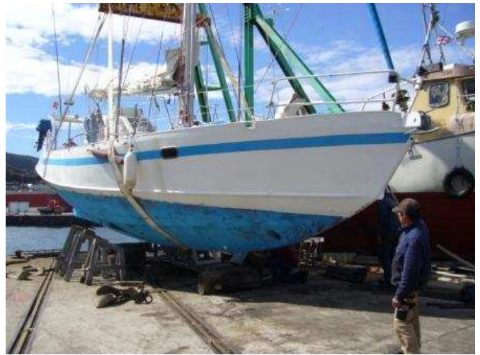
Baloum Gwen au sec sur le shipyard de Qaqortoq

remontée avec une grande habileté. Merci au chantier et aux compagnons Groenlandais qui ont rondement mené l'affaire pour remettre Baloum Gwen en état de re-naviguer au plus tôt !