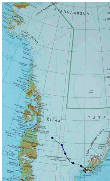
Progression au 15 juillet