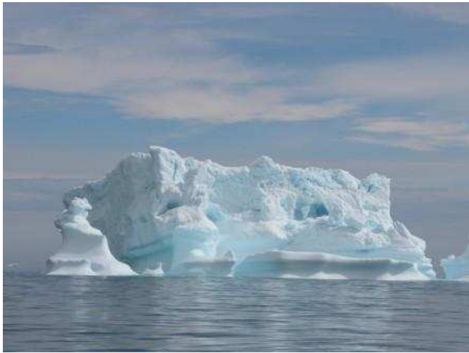
Paysage d'icebergs dans les fjords du Sud Groenland

Pensant être sortis d'affaire et faisant route sur Nanortalik, nous avons vu à nouveau la fatale ligne blanche étincelante se reformer à l'horizon. Il nous a fallu à nouveau mettre cap au Sud puis contourner largement vers l'Ouest : c'était renoncer à aller à Nanortalik où nous attendait la relève d'équipage, pour rejoindre enfin Qaqortoq (prononcer rrrarrortorq), ville la plus importante du Sud avec 3500 habitants. L'approche de cette côte nous a néanmoins offert une magnifique forêt d'icebergs étincelants sous le soleil enfin revenu, et une spectaculaire vue sur la calotte glaciaire. Pensée émue pour nos deux petits camarades en train de peiner là haut !