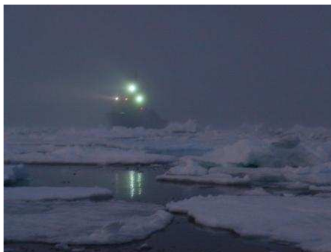
Bateau de Marine Danoise dans le pack du cap Farvel (Farewell)

A court de fuel, nous avons dû renoncer, et attendre dans une ambiance lunaire qu'un bateau de la marine danoise se déroute pour venir nous ravitailler. A couple de cette muraille d'acier, nous avons transbordé des jerricans, puis le navire nous a ouvert un passage dans la glace.