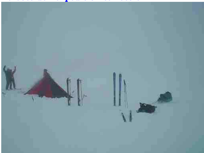
Entraînement d'hiver dans le blizzard d'auvergne (pour vous donner une idée de ce qu'ils endurent !)

Bilan après 33 jours de progression : Pascal et Fabrice ont rencontré des conditions météo particulièrement difficiles depuis le départ : vents contraires parfois violents, tempêtes, pluie de grésil cinglant à l'horizontale, et surtout des chutes de neige de 50cm tous les 2 jours, ne laissant aucune possibilité à la neige de se transformer. Pour couronner le tout, les températures de -5 à -10 ° sont aggravées par l'effet éolien. Le résultat est une progression de 481 km en 33 jours, largement en dessous de la moyenne prévue de 20 km par jour.