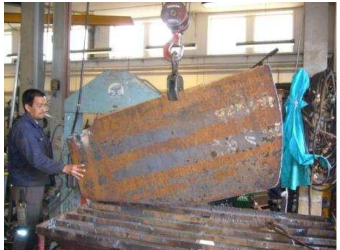
Fabrication de la nouvelle quille au chantier naval de Qaqortoq

A bientôt pour la suite des aventures « mouvementées » de Diagonale-Groenland !